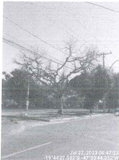
Figura 1 – Chorão morto.

Diante disso, encaminhamos o presente Relatório Técnico, bem como a respectiva autorização de supressão e destoca para a Secretaria de Serviços Urbanos e Obras para execução.